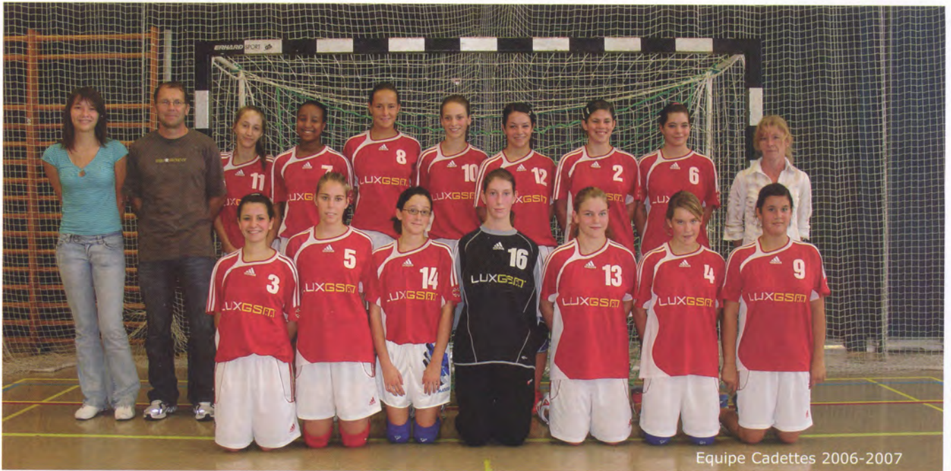
Equipe Cadettes 2006-2007